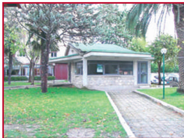
Sede della Pro Loco - P.zza Giolitti